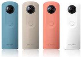
RICOH社製360° カメラ THETA SC