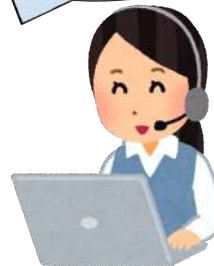
ミテクレ制作センター

※毎週水曜日・日曜日定休 ※複雑な物件など、余分に制作日数がかかる場合は受付完了メールにてお知らせいたします。